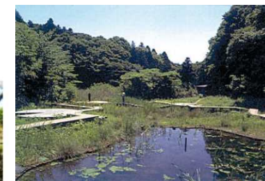
都市に残された緑地の保全