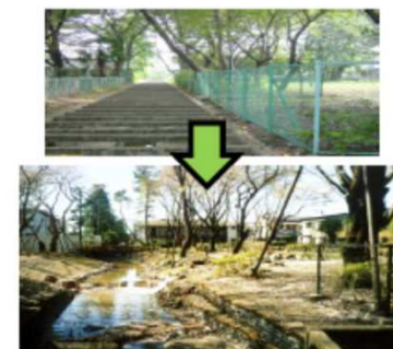
河川と公園との一体的な再整備